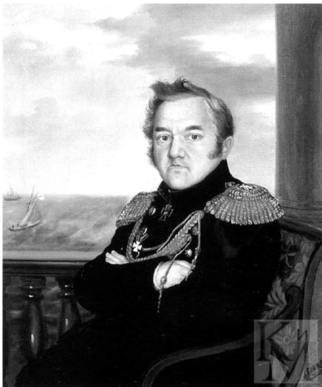
Рис. 1. М. П. Лазарев в Севастополе.