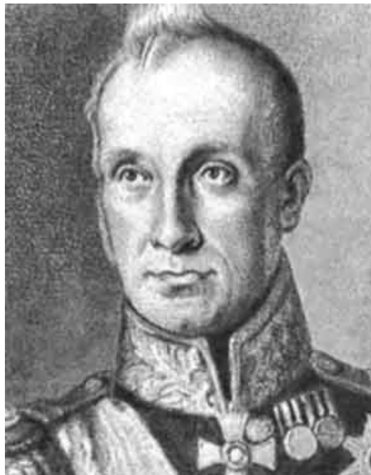
Рис. 3. А. С. Грейг.