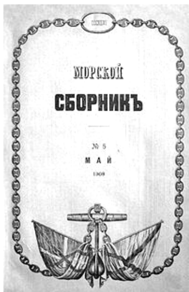
Рис. 2. Обложка журнала «Морской сборник» за май 1908 года.