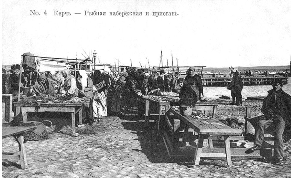
Керчь. Рыбная набережная и пристань. Фото начала ХХ в.

мати дозвіл від управи на виробництво даного промислу [32]. Лахмітникам було заборонено входити в будинки без дозволу власників, продавати ношений товар вони мали право виключно на товкучці.