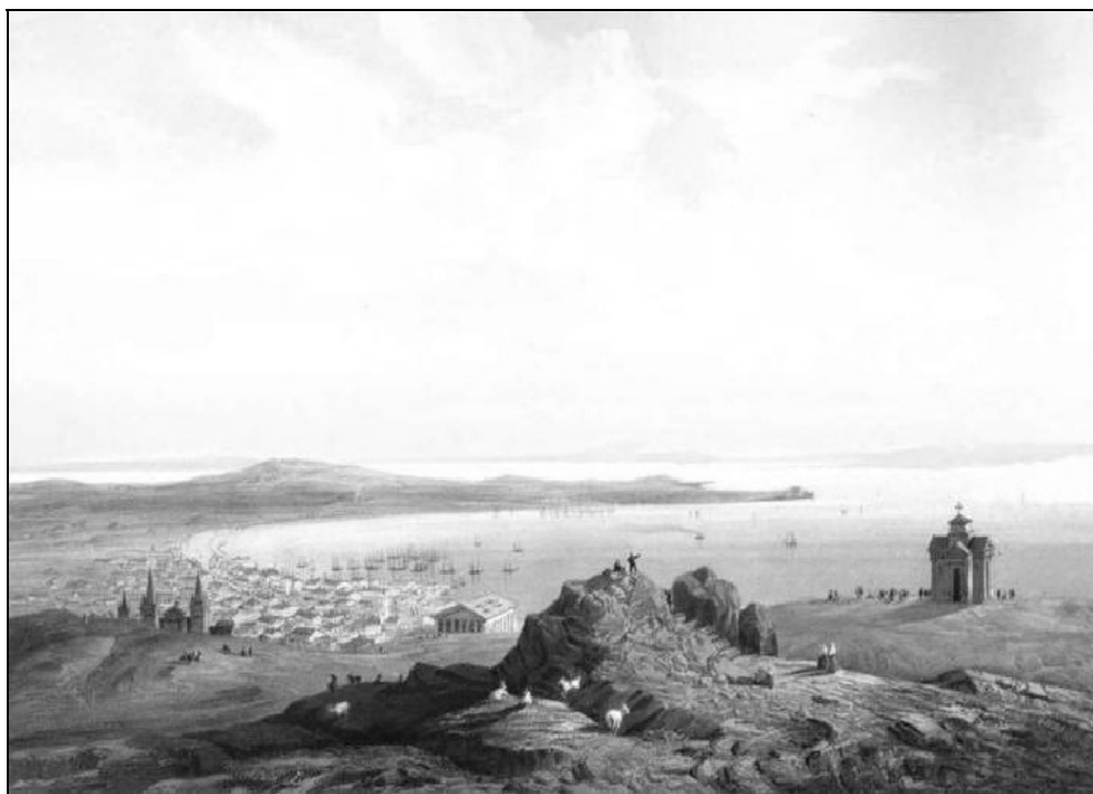
Рис. 2. Карло Боссоли. Общий вид Керченского залива с горы Митридат.