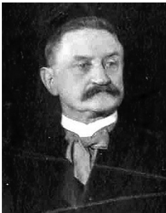
В. Д. Смирнов – профессор Санкт-Петербургского университета