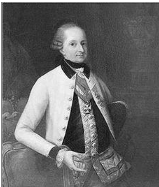
Миклош Иосиф Эстерхази (1714–1790)